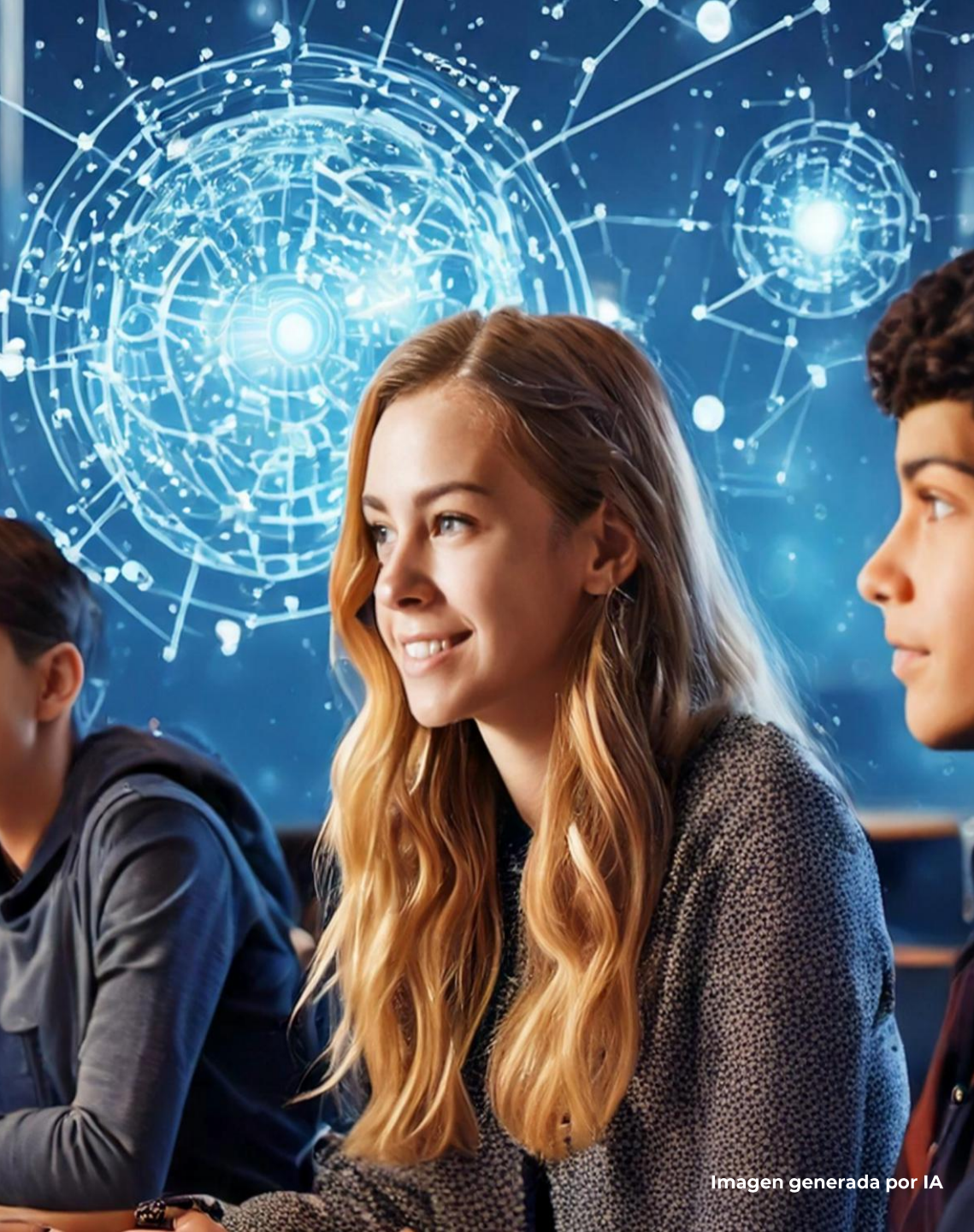
Imagen generada por IA